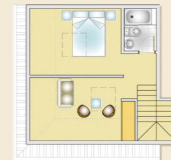
Ático B Planta bajocubierta