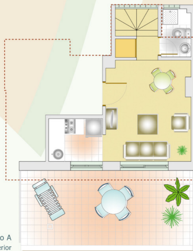
Ático A Planta inferior